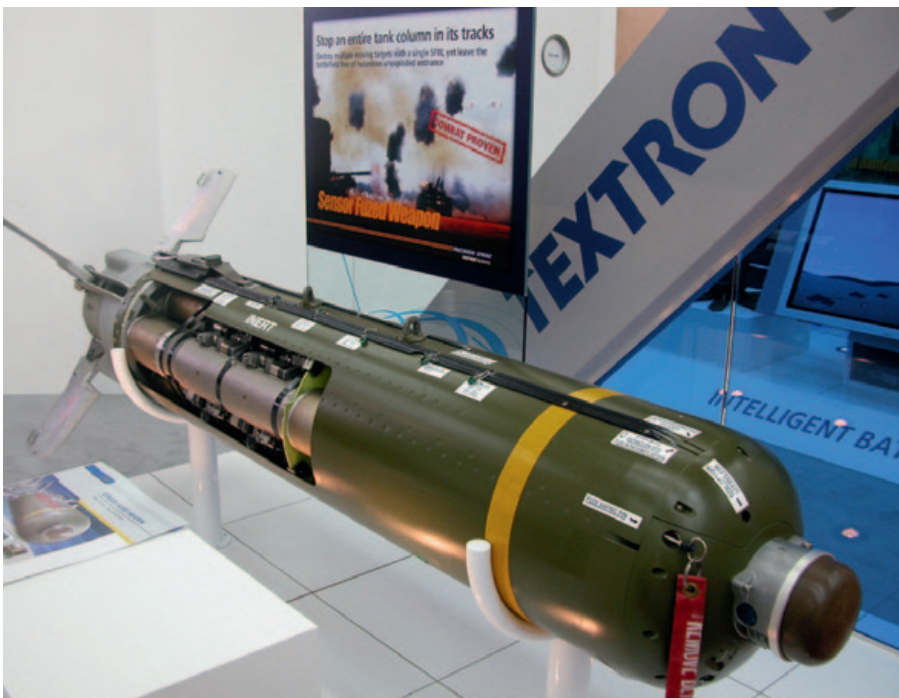
Der US-Hersteller Textron wirbt mit dem Slogan «Klare Siege, saubere Schlachtfelder» für seine modernsten Streuwurfbomben.

teile ihres Fonds CS ETF S&P 500. Ahnungslos. Doch dieser Fonds investiert unter anderem in den Streumunitionshersteller Textron, den Primus der Branche mit Sitz in Amerika. Deshalb bin ich nun Mitbesitzer von Textron. Zudem gehören mir leider 1 500 UBS-Aktien. Leider, weil auch die UBS in diesem Business mitmischt. Und zwar mit der grossen Kelle: Als Besitzerin von rund 9 Millionen Textron-Aktien zählt sie zu den zehn grössten institutionellen Anlegern. Mitgegangen, mitgefangen, mitgehangen.