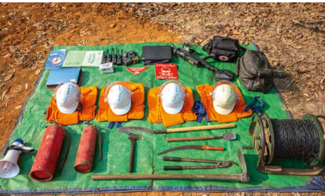
Equipement d'une équipe d'élimination de munitions non explosées au Cambodge.